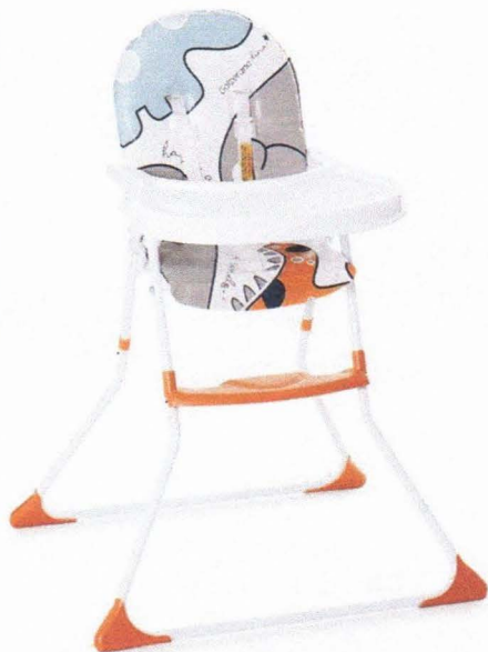
Passa o mouse para ampliar a imagem